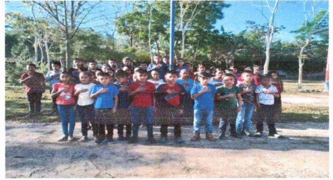
Foto 2: Se Observa que el ambiente que los alumnos realizan acto civico bajo el sol.