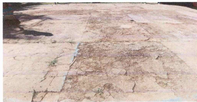
Foto 3: se obsrva que el piso del corredor del Centro Educativo se encuentra en mal estado